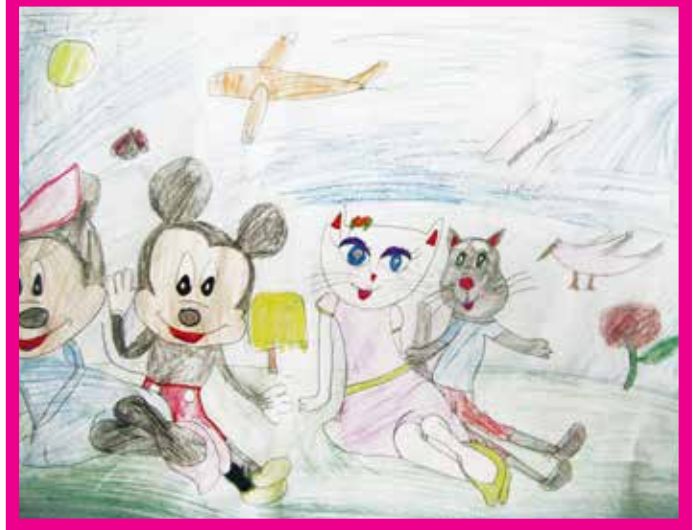
Dilan AKBIYIK 4/A