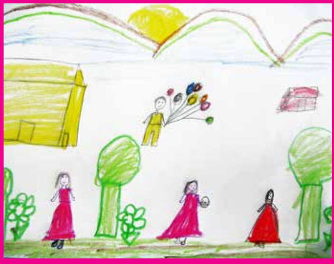
Göksal KARAMAN 2/A