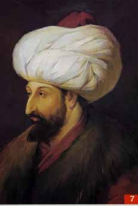
FATİH SULTAN MEHMED H. 855-886 M. 1451-1481 55x65 Tuval / Yağlı Boya