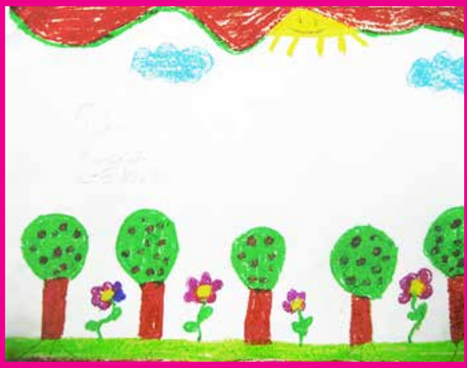
Tuhana KURUKAFA 4/B