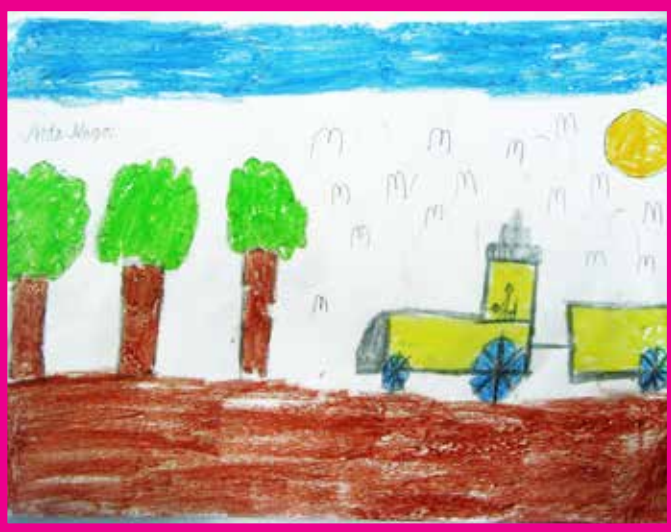
Arda ALAGÖZ 3/A