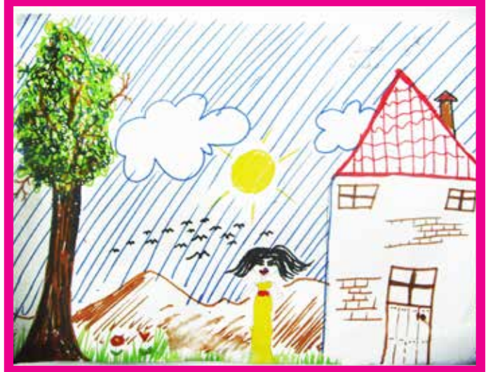
Seçil TEKİN 3/A